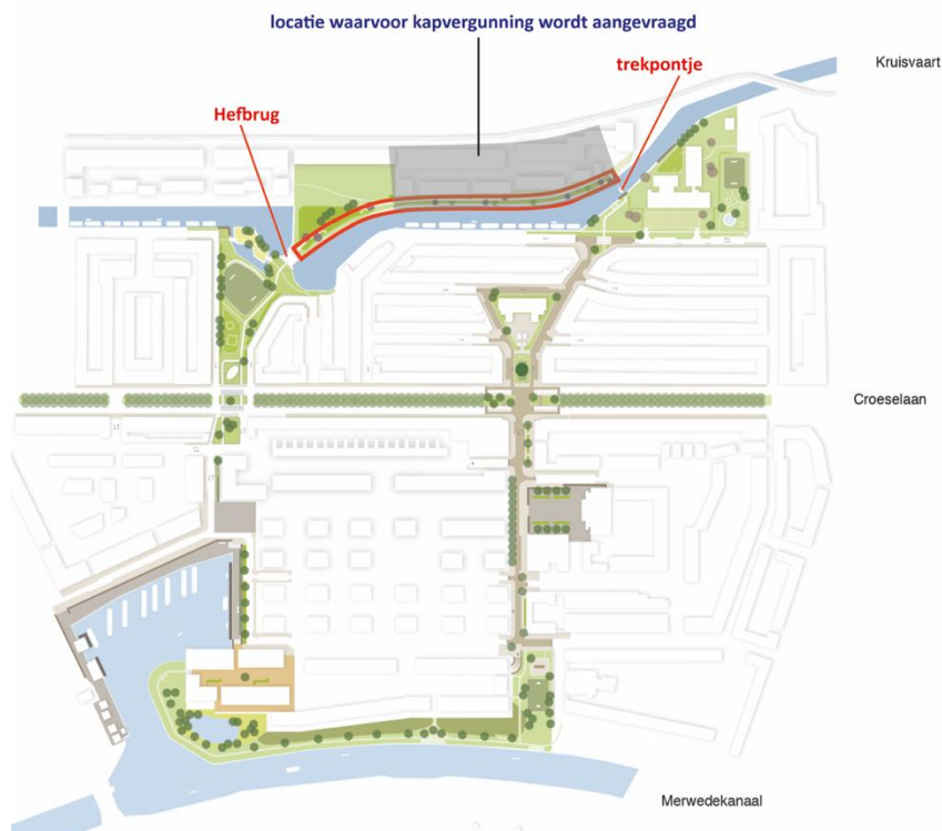
Ringpark Dichterswijk met locatie waar een omgevingsvergunning wordt aangevraagd voor de kap van 56 bomen

Bij deze geven wij - Stichting Vrienden van het RingPark Dichterswijk – een reactie op de aanvraag door MRP Kruisvaartkade BV voor een omgevingsvergunning in de Kruisvaartzone voor het kappen van 56 bomen met een diameter van meer dan 15 cm. Tegelijkertijd met de kap van de bomen zal de aanwezige bos- en oevervegetatie worden verwijderd, maar daarvoor hoeft geen vergunning te worden aangevraagd. Het verwijderen van alle beplanting is des te pijnlijker omdat de oeverzone langs de Kruisvaart, een bospad genaamd het Plukpad, onderdeel is van het RingPark Dichterswijk. Het RingPark is een groene structuur in Dichterswijk met een circa 3 km lange wandelroute. Binnen het RingPark is het Plukpad het meest natuurlijke deel en heel geliefd bij vele bewoners en lunchwandelaars. De oever- en bosbeplanting langs het Plukpad draagt bij aan de leefkwaliteit van de wijk en is biotoop voor vele bomen, planten en dieren, waaronder de ijsvogel. Als buurtbewoners en professionals hebben we ons inmiddels 12,5 jaar voor het RingPark ingezet. Vaak wordt het RingPark, vooral ook bij de gemeente Utrecht, genoemd als een mooi voorbeeld van SamenStad Maken.