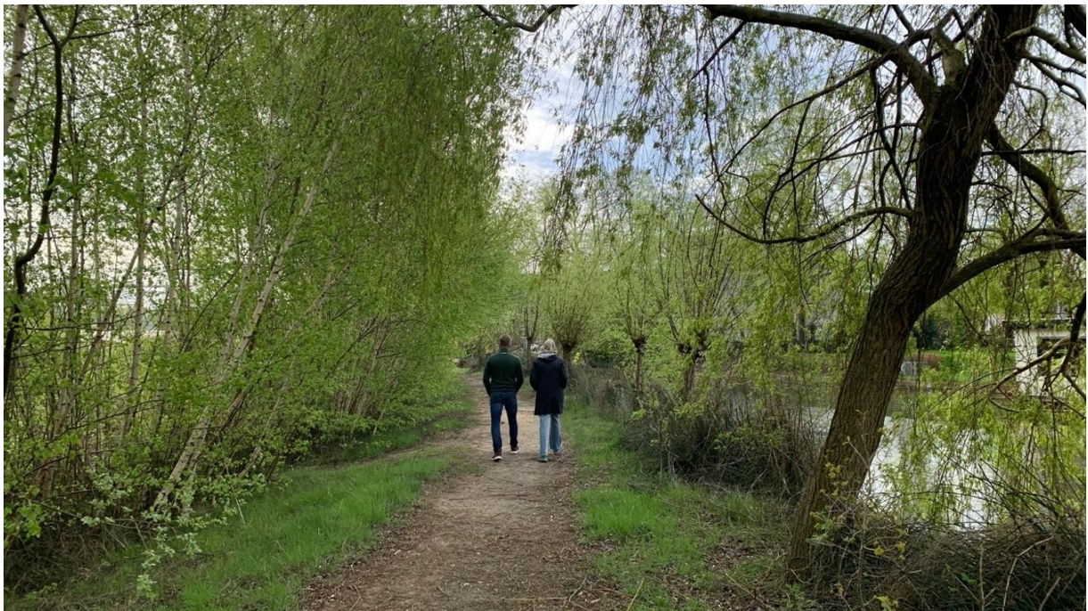
Het Plukpad en de daarbij horende bos- en oeverbeplanting

Oftewel: er is met het RingPark geen contact vooraf geweest en de in de aanvraag verstrekte participatie-informatie is daarom in ieder geval zeker niet volledig juist.